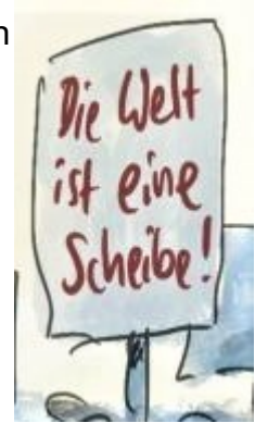
Abbildung 5: Verschwörungstheorien

Verschwörungstheorien gibt es in allen Farben und Formen und zu jedem Thema, manche sind kreative Spinnereien, aber sie reichen auch bis zu antisemitischen oder satanistischen Verschwörungen. Meist bieten Verschwörungstheorien eine einfache Wahrheit für komplizierte oder beängstigende Themen. Solche Theorien leben von der Unsicherheit, vor der Angst des Kontrollverlustes.