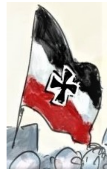
Abbildung 4: Reichsflagge

In der Karikatur ist auf der linken Seite deutliche eine Reichsflagge zu sehen, die Flagge ist als Symbol und Erkennungszeichen in der Neonazi-Szene besonders beliebt. Auch amtlich gesehen stellt die Reichsflagge einen Ausdruck politischer Gesinnung dar.