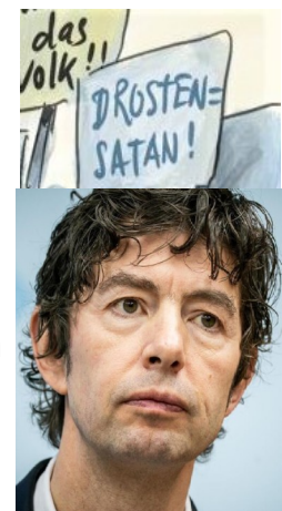
Abbildung 8: Drosten

Sein Forschungsschwerpunkt sind neu auftretende Viren (emerging viruses). Öffentlich bekannt wurde Christian Drosten während der Covid-19-Pandemie, da er zu den häufigst erwähnten Wissenschaftlern zählte. Im Verlauf der Pandemie berät Drosten Politik und Behörden und ist in den Medien als Experte präsent. Später wird er sogar als „Mann der Republik“ betitelt.