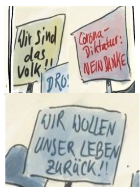
Abbildung 7: Corona-Diktatur

Das Bild einer Corona-Diktatur Abbildung 7 oder Unterdrückung verbreitet sich immer weiter, es herrscht Unzufriedenheit mit der Regierung. Es ist das derzeitige „System“ was kollektiv abgelehnt wird. Die Menschen fühlen sich eingeschränkt, und dies vor allem in ihren unantastbar geglaubten Grundrechten. Sie finden, dass die Einschränk-