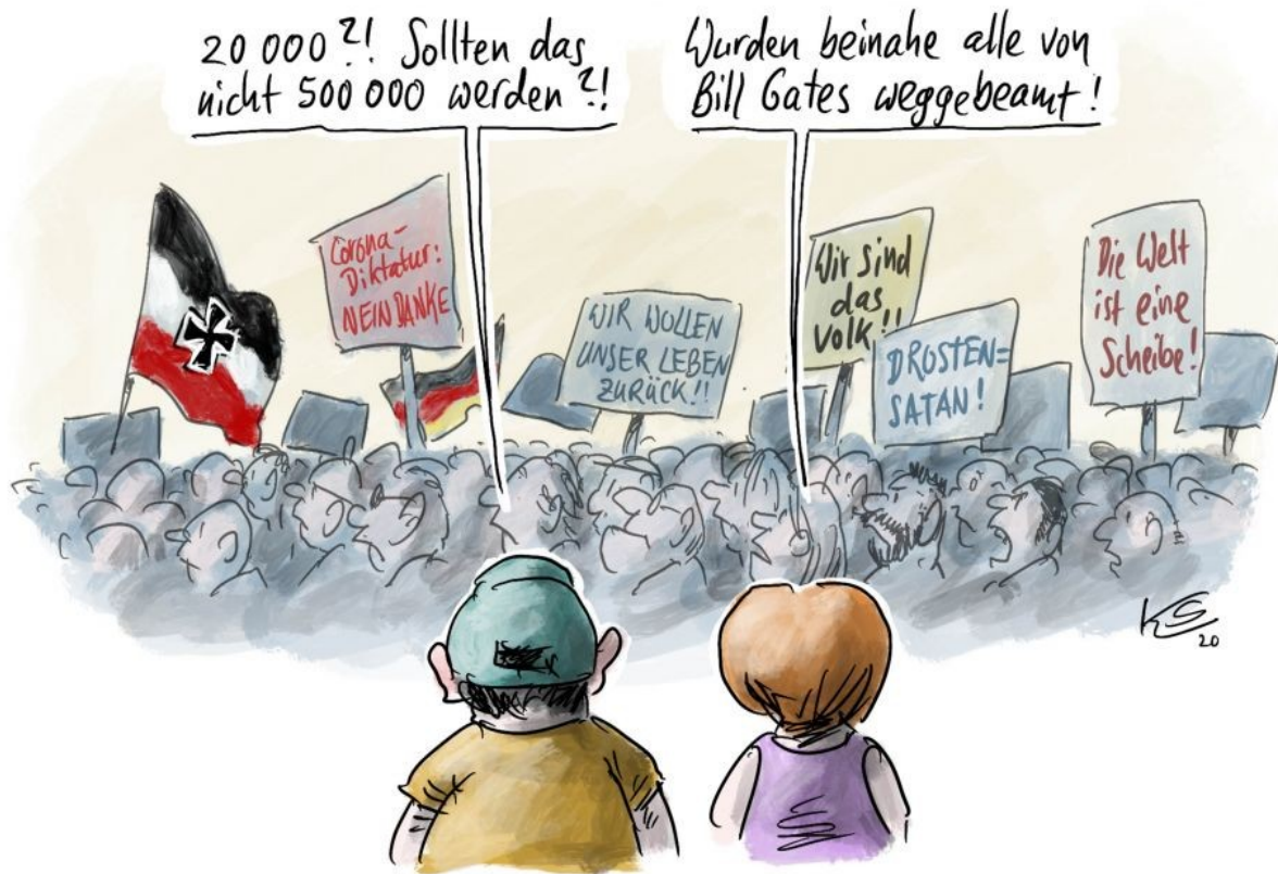
Abbildung 1: „Weggebeamt?“