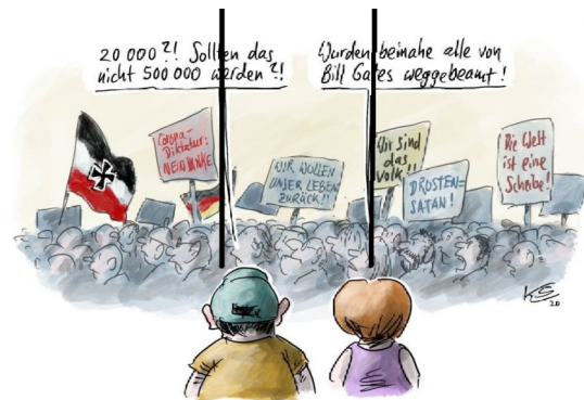
Abbildung 3: Karikatur gedrittelt

Im Hintergrund der Karikatur sieht man eine große Menschenmenge. Zu sehen sind von den Menschen nur die Gesichter, alles ist in blau-grau gehalten. Farblich hebt sich die Reichsflagge und die Deutschlandflagge enorm ab, auch die unterschiedlichen Plakate erscheinen in gedeckten Farben. Die Mimik der Menschen hat viele Facetten: